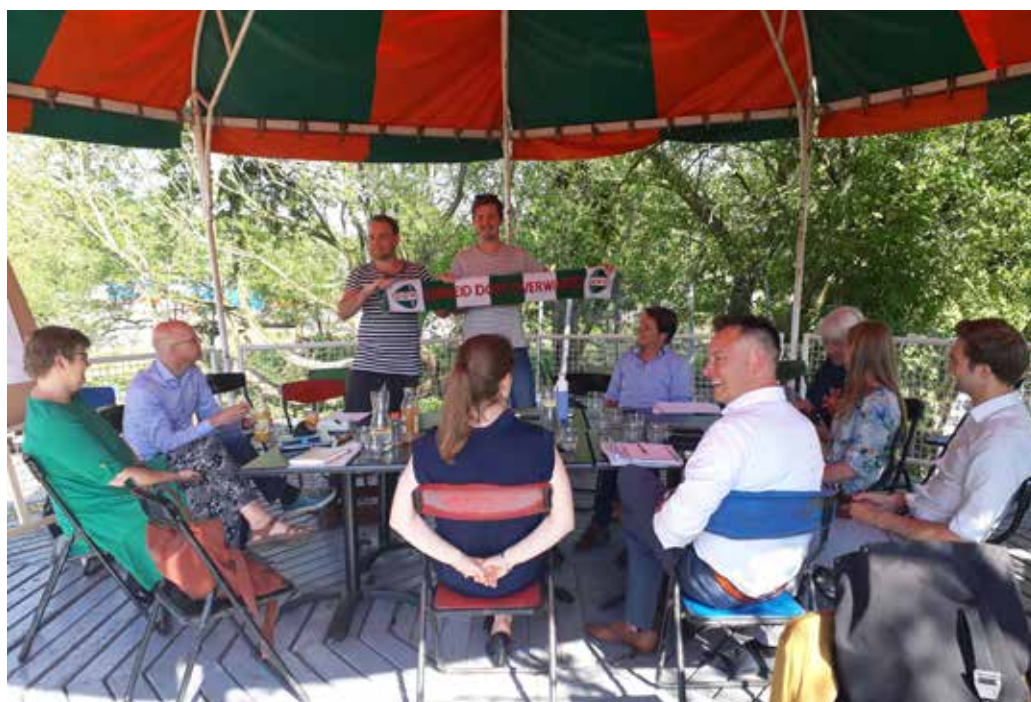
'Laat studenten en Overvecht samen voetballen op sportpark Vechtzoom'