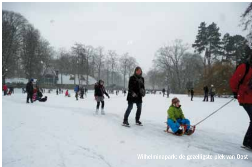
Wilhelminapark: de gezelligste plek van Oost