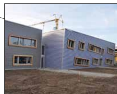
Nieuw Utrechts Stedelijk Gymnasium

Er gebeurt veel met de scholen in Utrecht-Oost. Tijd om in gesprek te gaan met twee vertegenwoordigers van de gemeente die u hier meer over vertellen.