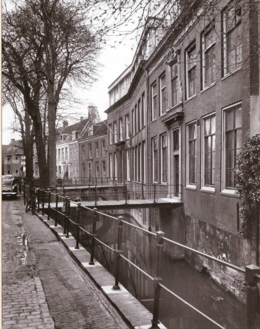
Bonifacius-Lyceum met het toegangsbruggetje, Kromme Nieuwegracht 3, ca. 1950.