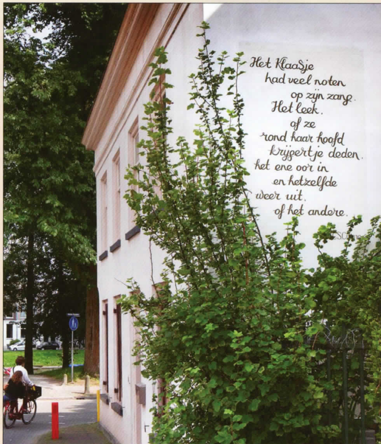
Een tekst uit 'Muziek over het water' op een zijgevel Nicolaas Dwarstraat.

Als beroemde leerling van het St. Bonifacius-Lyceum, nu het St. Bonifatiuscollege, werd hij opgenomen in de 'Hall of Fame' van de school.