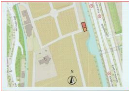
Beoogde locatie crematorium zoals aangegeven in de vergunningaanvraag

Maar ook zonder een wijziging van het padenstelsel, heeft het crematorium hierop grote impact. Door de plaatsing van het crematorium zal de routing c.q. het gebruik van het terrein van de begraafplaats voor een groot deel veranderen. Op de locatie waarop het crematorium is voorzien, staat nu geen gebouw en deze locatie trekt nu dus geen, althans weinig, personen en verkeer aan. Met de realisatie van een crematorium op de beoogde locatie, aan de rand van de begraafplaats, ontstaat een andere, althans intensievere, routing naar deze locatie op de begraafplaats vanwege bezoekers, personeel, onderhoudsmedewerkers etc. van het crematorium. Dit betekent dat met de realisatie van het crematorium niet alleen de locatie van het gebouw voor het crematorium een andere bestemming krijgt, maar ook de route er naartoe anders en veel intensiever zal worden gebruikt.