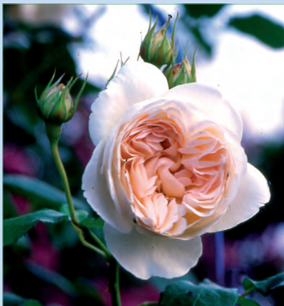
Rosa 'Sebastiaan Kneipp', een van de rozen in het huidige Rosarium, genoemd naar de Beierse priester die als grondlegger van de natuurgeneeskunde wordt beschouwd.

Om het publiek voor te lichten over de verschillende variëteiten en om de kwekers reclame te laten maken kreeg iedere roos een emaille bordje met, volgens de Nieuwe Rotterdamse Courant in 1919: 'een uittreksel uit haar geboorteregister en uit haar staat van dienst. En men ziet op de kronkelende paden tusschen de rozen