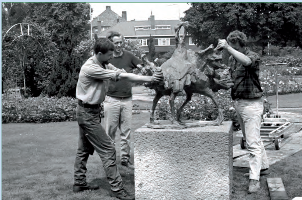
Plaatsing van het beeld 'Vechtende Kalkoenen' van de beeldhouwer Th. Mulder (2e van links) op 21 juli 1965.