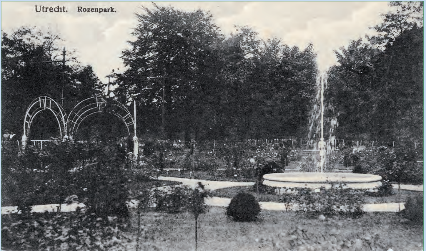
Ansichtkaart van het Rosarium, kort na de opening, 1913. Dit is de oudst bekende foto van het rozenpark.