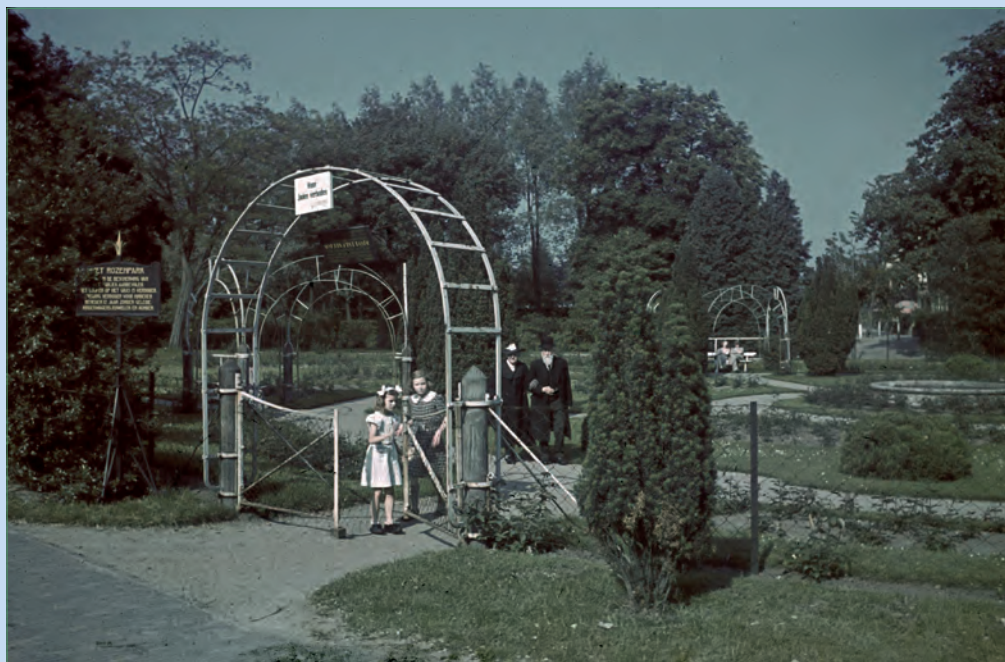
'Voor Joden verboden', gefotografeerd in 1942.