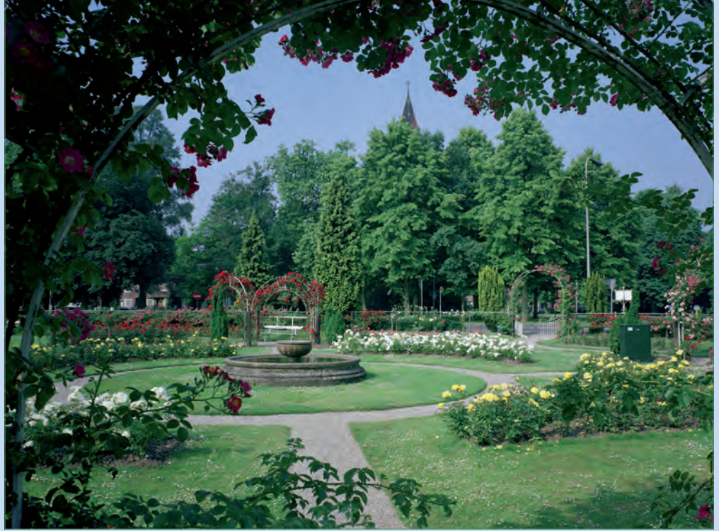
Het Rosarium in 1993.