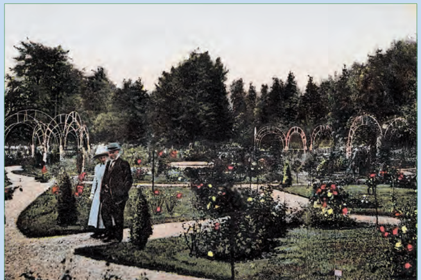
Het 'mooiste plekje van Utrecht' in 1922.

maaiveld. Het talud dat het park van de omgeving scheidde, werd beplant met klimop en een rand Buxus suffruticosa (Voetpalm). Om de eentonigheid van de verzameling bloemen van één soort te breken liet de plantsoenmeester in het midden ruimte voor een vaas, fontein of zonnewijzer (het werd uiteindelijk een fontein). Het ontwerp voorzag verder in 11 plantvakken met in totaal 144 bedden. De rozenkwekers van NJR zagen kans om daarin steeds 160 tot 200 soorten en variëteiten in bloei te krijgen: struikrozen, stamrozen en leirozen in de kleuren licht- tot donkerrood, geel, wit en rose. Op foto's uit de beginjaren maakt het Rosarium dan ook een overvolle indruk, een kakofonie van kleuren, maar bij het publiek van die tijd dwong dat juist bewondering af.