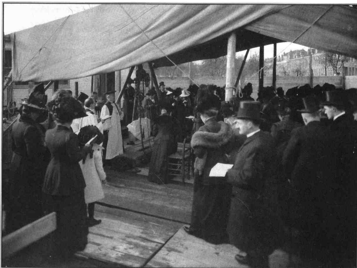
Eerste steenlegging van de Engelse Kerk aan het Van Limburg Stirumplein, november 1911

De stichting en geschiedenis van Holy Trinity Church Utrecht