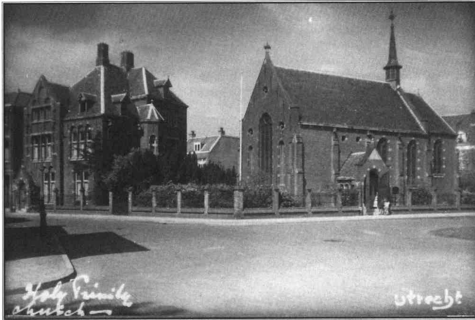
De kerk en de pastorie, ca. 1920

dat gasten en belangstellenden in de kerkbanken moesten staan. Op 2 juni 1913 werd het kerkgebouw ingewijd door Anglicaanse bisschop Bury van Noord- en Centraal-Europa. Bingham zou deze plechtigheid niet meer meemaken. Op 1 maart van dat jaar was hij overleden na een langdurig ziekbed. In 1913 moest de kerk al worden uitgebreid. Omdat de voorganger van de Anglicaanse gemeente in Amsterdam niet meer kon officieren in Utrecht, moest er een vaste voorganger voor de nieuwe gemeente gevonden worden. De stichters van de kerk in Utrecht bepaalden dat hij een 'Protestant gentleman' moest zijn afkomstig van de theologische opleiding aan de universiteiten van Oxford of Cambridge. De weduwe Bingham stelde geld beschikbaar voor de bouw van de pastorie. In 1914 werd de Britse geestelijke, Reverend Alban Blakiston, benoemd tot voorganger van de kerk. Sinds-