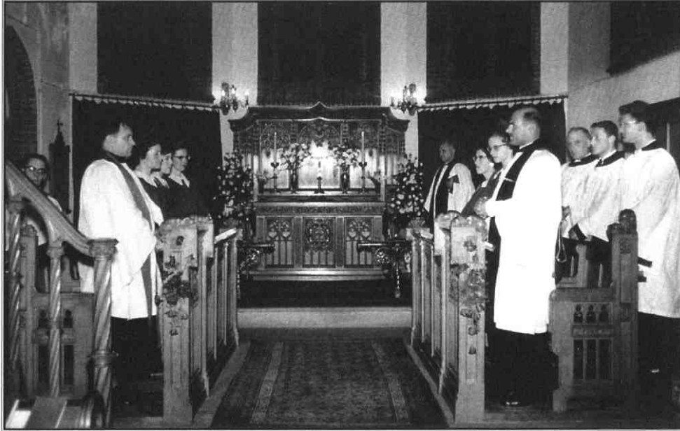
Naoorlogse dienst in de kerk

meenschap in Utrecht. Vanaf de jaren zestig trad er een geleidelijke kentering op. De voorganger verzochtte bij de viering van het 50-jarige bestaan van de kerk: 'Our church has many friends, to a great extent of Dutch nationality, but we do wish that the British people, for whom this Church was built in the first place, would show more interest and take a more active part in it.' Eind jaren zeventig steunde de kerkenraad het voorstel waarbij voortaan wekelijks Holy Communion -vieringen gehouden werden. Voor deze diensten nodigde de kerk mensen van andere gezindten uit om deel te nemen aan het Heilig Avondmaal. Ook kwamen er oecumenische Evensongs die voorgedaan werden door geestelijken uit andere gezindten. Door die activiteiten profileerde de Anglicaanse kerk in Utrecht zich steeds meer als het milde midden tussen de verschillende christelijke stromingen. Sinds enige jaren is de liturgie van de