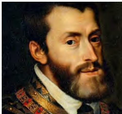
Filips II (1527 - 1598)

Hij gedroeg zich als een Iraanse ayatollah en stuurde Alva hierheen, die vreselijk tekeer ging en de Raad van Beroerten in het leven riep. In de negen jaar dat die Raad actief was, zijn er 10.000 veroordelingen tegen protestanten geweest en 1100 executies. Daar kwamen nog eens 2000 executies bij, die de katholieke inquisitie op haar geweten had. Utrecht kreeg het hierbij stevig voor de kiezen. Er werden 288 calvinisten geëxecuteerd op een bevolking van 27.500 inwoners.