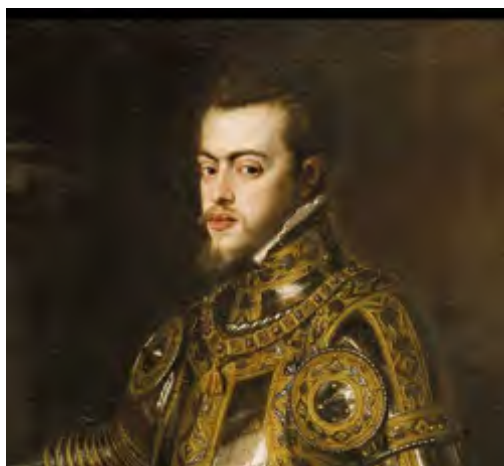
Karel V (1500-1558)

Zo niet de keizer, Karel V , die bang was dat zijn rijk met het nieuwe geloof uiteen zou vallen. En nog veel minder zijn zoon Filips II , die de aanhangers letterlijk te vuur en te zwaard bestreed. Filips was verantwoordelijk voor Spanje, de koninkrijken Milaan en Napels, de Nederlanden en voor de Nieuwe Wereld. Maar nergens was de wetgeving tegen kettters zo streng als in de Nederlanden.