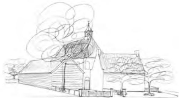
Reconstructietekening van de katholieke kerk aan de Biltstraat, met links de schuur waarin aanvankelijk de schuilkerk gevestigd was en rechts de herberg Het Boompje die later gebruikt werd als pastorie. Tekening: Frans Kopp/ Archeologisch en Bouwhistorisch Centrum, Utrecht (1993).

Dat werd in 1880 de Oude-Kerkstraat . Het gebouwtje aan de straat werd pastorie. Daarachter lag een grote schuur. Dat werd de kerk en daar achter lag een groot stuk warmoezeniersland. Alles waar nu Deken Roes-, Adriaan-, Sweelinckstraat en de scholen liggen. Het torentje zat er overigens in die tijd nog niet op, want dan leek de schuur te veel op een kerk.