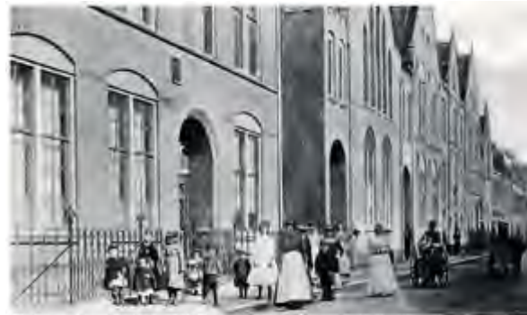
21. De eerste school aan de Adriaanstraat (nr. 26), met links de zijgevel van School A (1901), die evenals de uitspringende verbinding (1904) tussen beide scholen, is ontworpen door Gerard Ebbers, 1905.

In 1902 werd alles in gebruik genomen: de zusters het klooster en de kinderen de twee nieuwe scholen, vastgebouwd aan de oude.